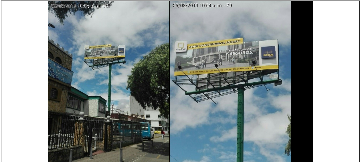
Foto No.1: Vista del predio y de la estructura de la valla tubular, que se encuentra en buen estado y estable, instalada en la Av. Carrera 30 No. 1F-14 (dirección catastral), orientación Norte-Sur.